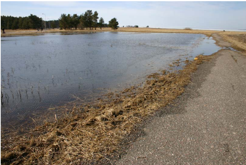
Foto 2. Kevadine suurvesi Jaama ojust lääne pool rannas. Asukoht vt joonisel 2 punkt 15.