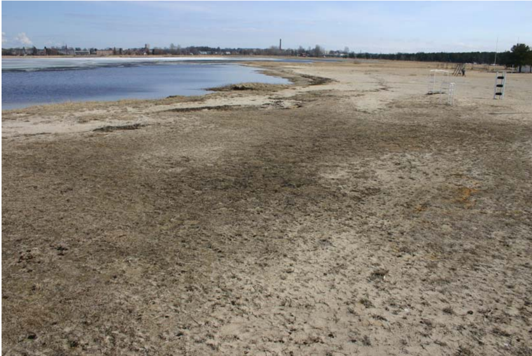
Foto 1. Rand Paralepa külalistemaja piirkonnas. Asukoht vt joonisel 2 punkt 10.