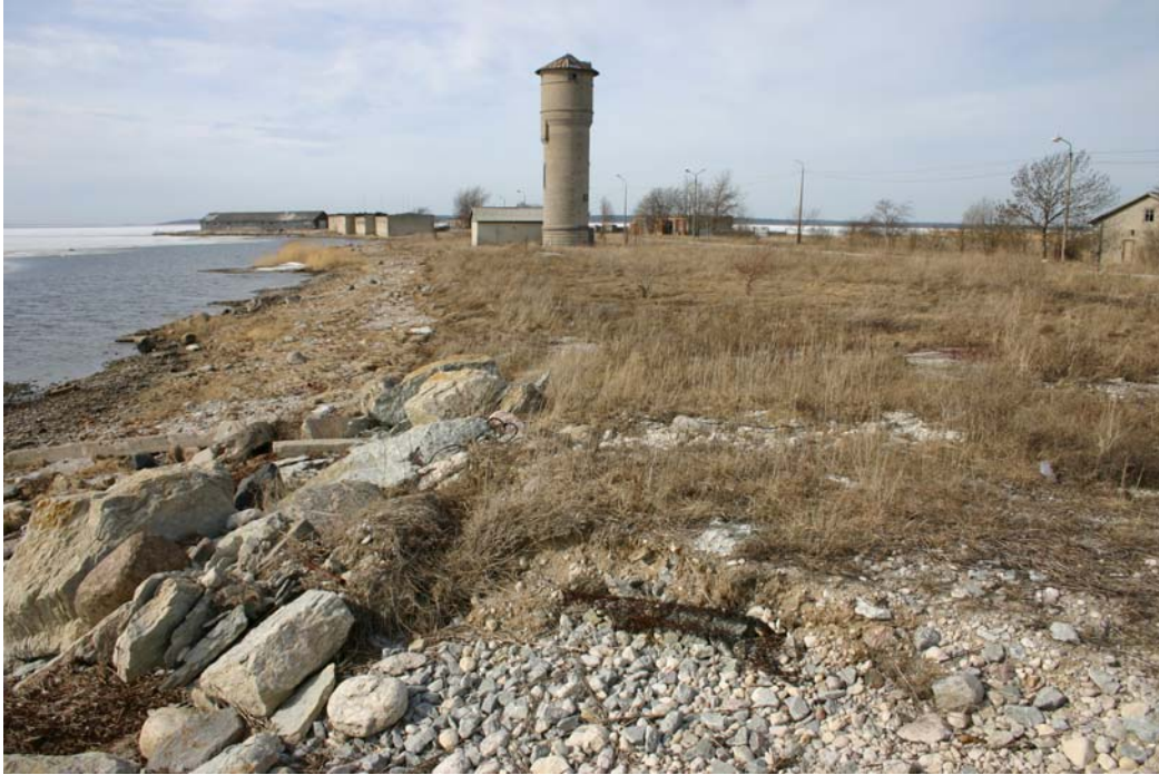
Foto 7. Krimmi holmi edelarand. Asukoht vt joonisel 3 punkt 53.