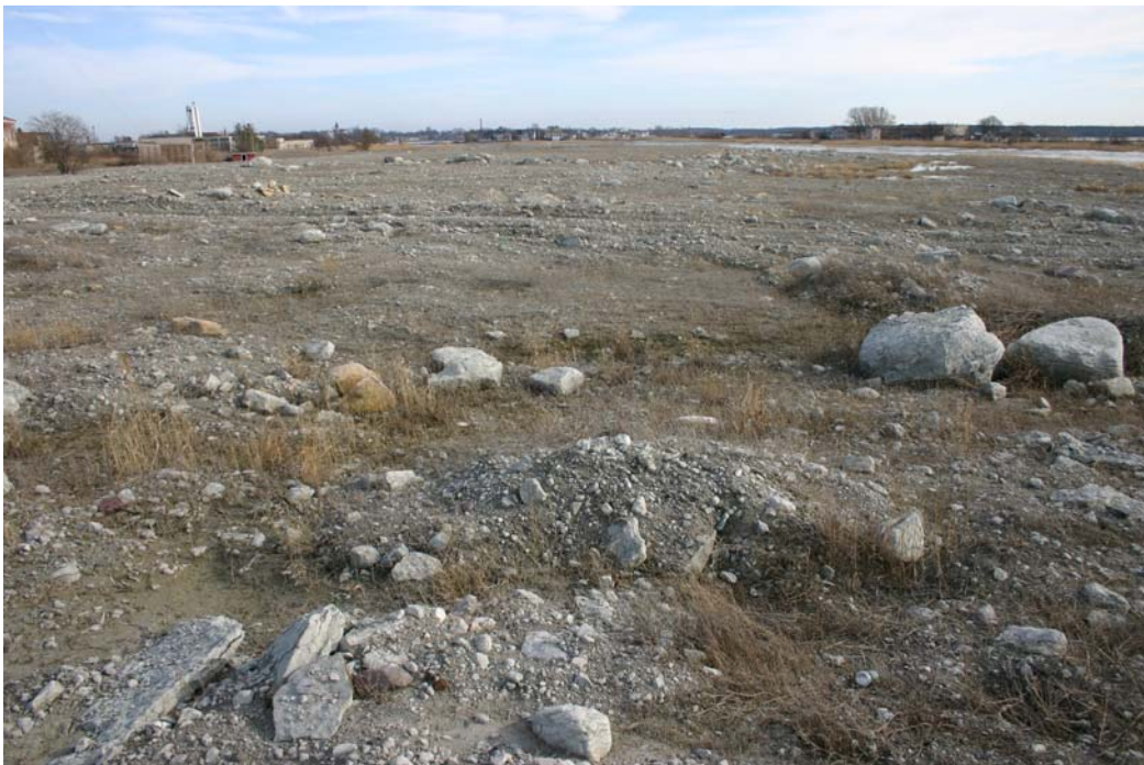
Foto 10. Bürgermeistri holmi on veetud mitmesugust täitematerjali. Asukoht vt joonisel 3 punkt 70.