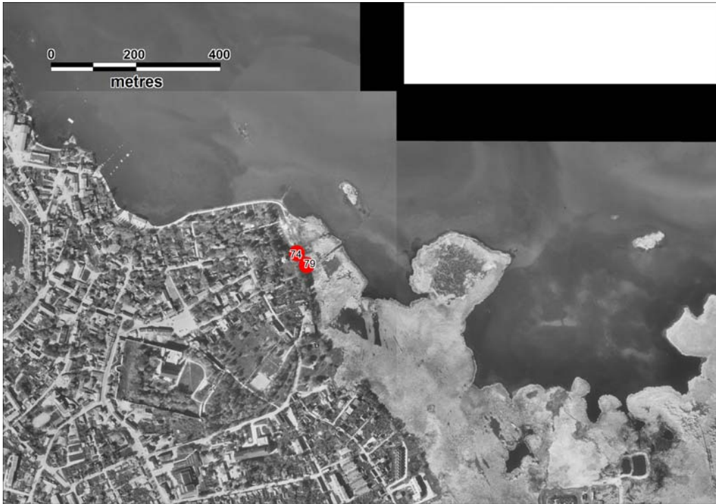
Joonis 4. Rannalõik promenaadi algusest Tagalahes kuni Randsalu ojani