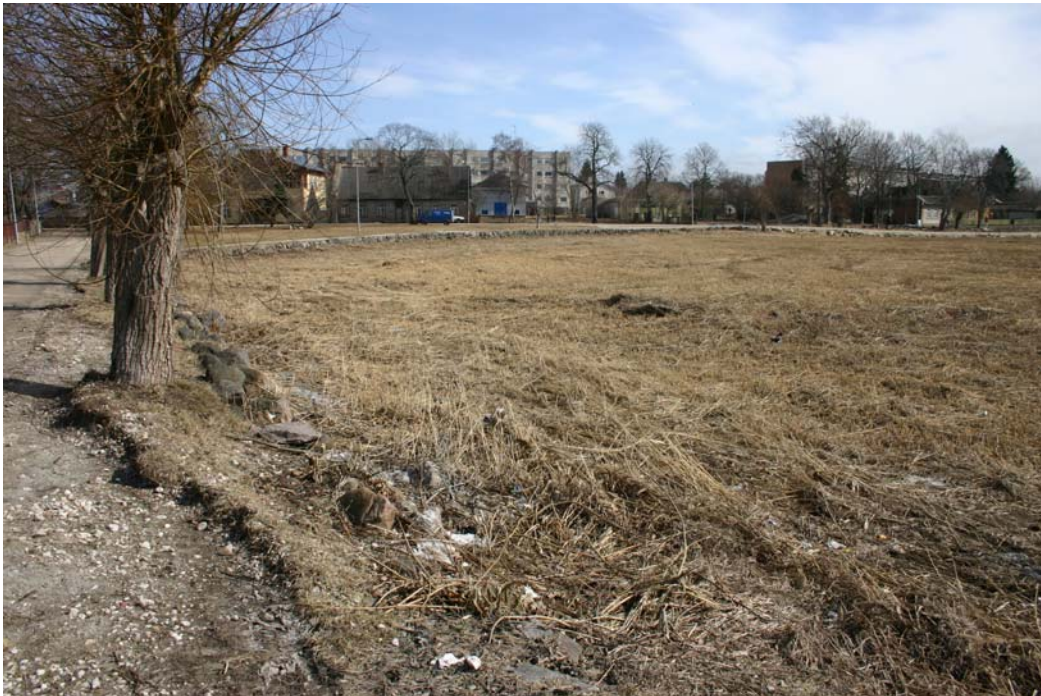
Foto 4. Õhtu kalda piirkonnas on rand roostunud ja lai. Asukoht vt joonisel 2 punkt 31.