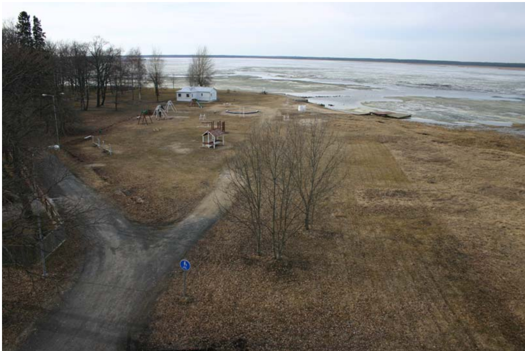
Foto 11. Vaade Aafrika rannale. Asukoht vt joonisel 4 punkt 74. 16.04.2006.a.