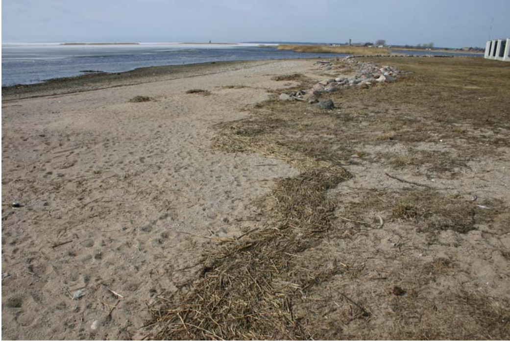
Foto 5. Rand kastinina piirkonnas. Asukoht vt joonisel 2 punkt 33.