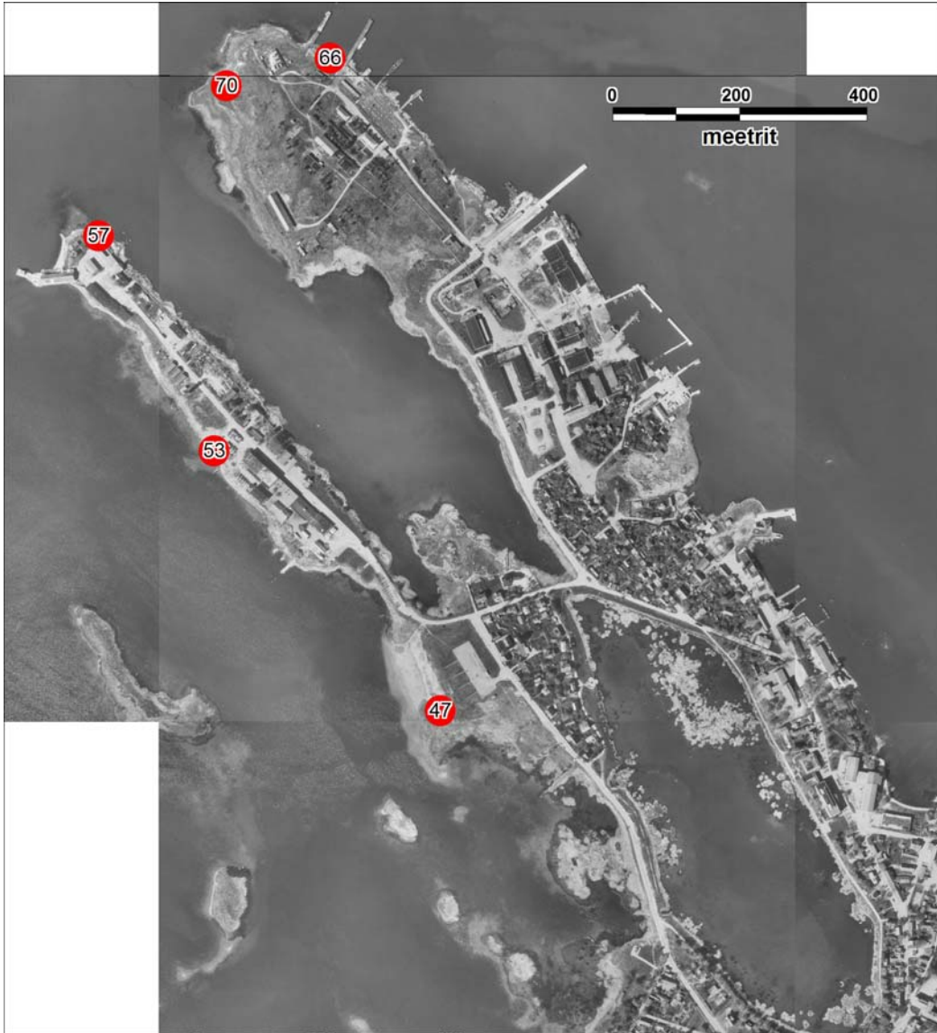
Joonis 3. Rannalõik Kastina ranna piirkonnast kuni promenaadi alguseni Tagalahes