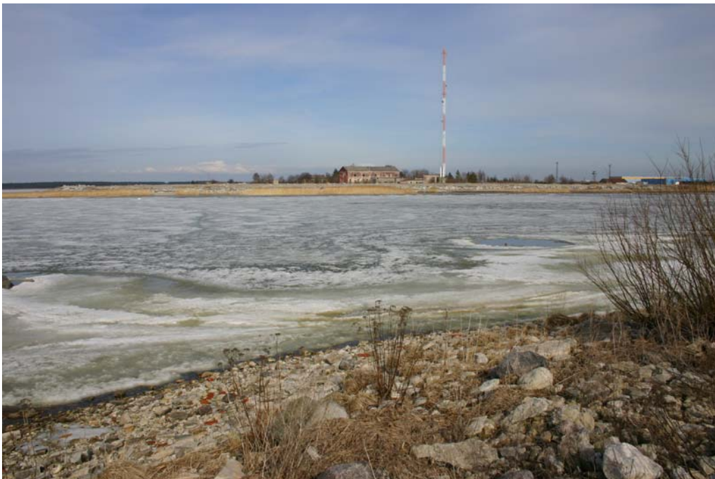
Foto 8. Vaade Krimmi holmilt üle Suure Viigi Bürgermeistri holmile. Asukoht vt joonisel 3 punkt 57.