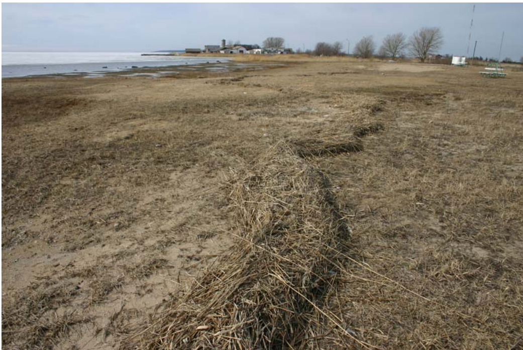
Foto 6. Supelrand Lahe tänava piirkonnas. Roostiku vall näitab viimast ajuveepiiri (kõrgvee). Asukoht vt joonisel 3 punkt 47.