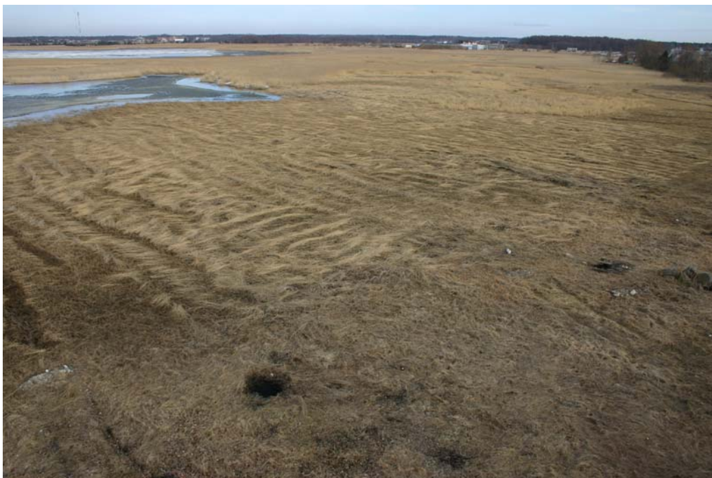
Foto 12. Vaade roostikule Haapsalu linna idapiiril. Asukoht vt joonisel 4 punkt 79.