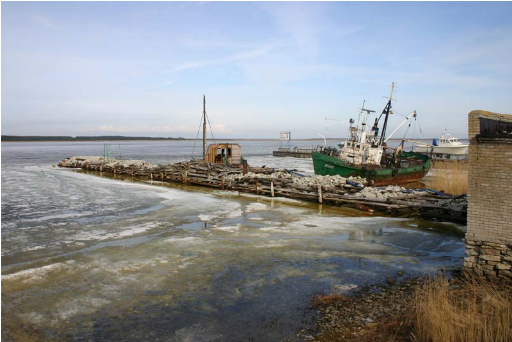
Foto 9. Kaid Bürgermeistri holmi kirdeosas on aastatega lagunenu. Asukoht vt joonisel 3 punkt 66.