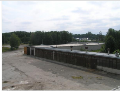
VAADE PLANEERINGU ALAL PAIKNEVATELE KUURIDELE