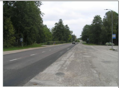
VAADE KILTSI TEELT, PILDIL PAREMAL PLANEERINGU ALA