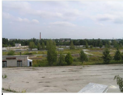
VAADE PLANEERINGU ALALE