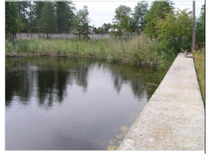
VAADE PLANEERINGU ALAL PAIKNEVALE TIGILE