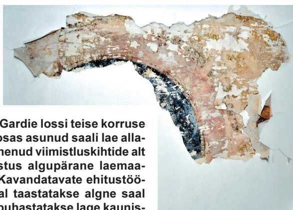
De la Gardie lossi teise korruse keskosas asunud saali lae allapudenud viimistluskihtide alt paljastus algupärane laemaaling. Kavandatavate ehitustööde ajal taastatakse algne saal ning puhastatakse lage kaunistatud laemaaling.